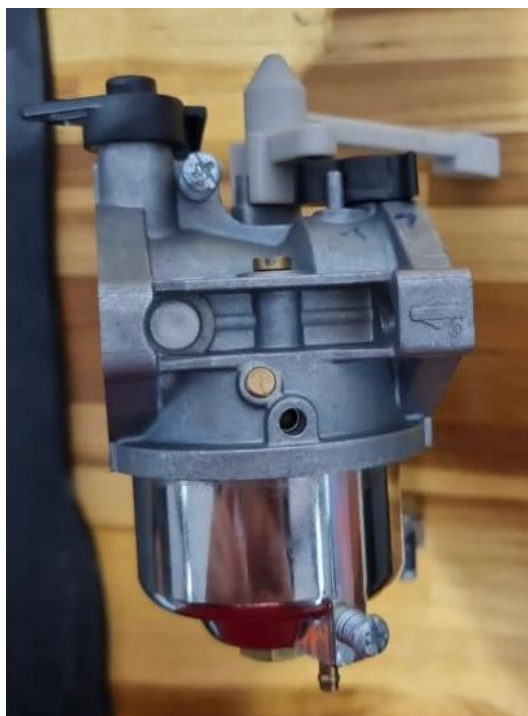
Figura 1 – Carburador Briggs e Stratton novo 8400885, Motor 19L - G1