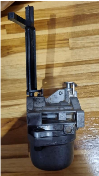
Figura 3 – Carburador Briggs e Stratton antigo 799060, Motor 19L