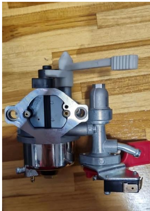
Figura 4 – Carburador Briggs e Stratton novo 8400885, Motor 19L - G1