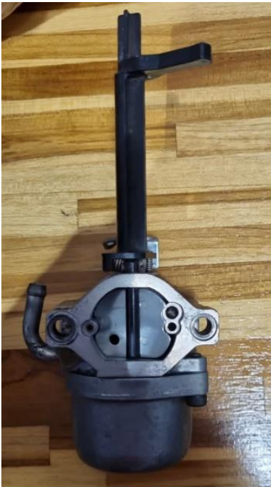
Figura 1 – Carburador Briggs e Stratton antigo 799060, Motor 19L