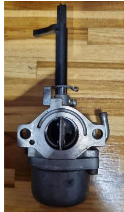
Figura 4 – Carburador Briggs e Stratton antigo 799060, Motor 19L