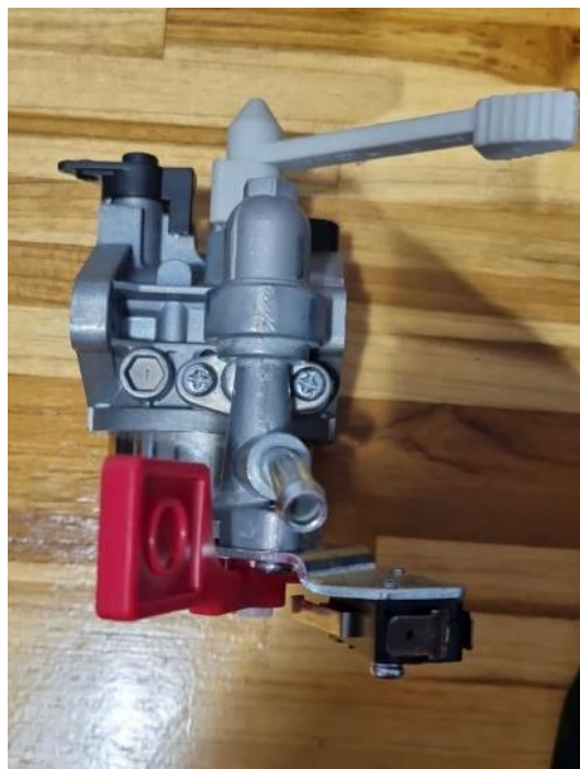
Figura 3 – Carburador Briggs e Stratton novo 8400885, Motor 19L - G1