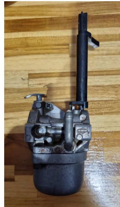
Figura 2 – Carburador Briggs e Stratton antigo 799060, Motor 19L