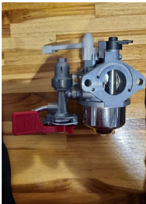
Figura 2 – Carburador Briggs e Stratton novo 8400885, Motor 19L - G1